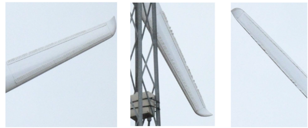
Abb. 2: Flaps an der WKA nach zwei Monaten Laufzeit; Einsatz Juni/Juli