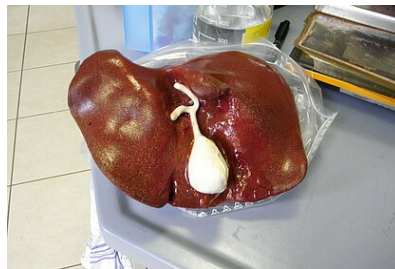
Abb. 2: Leber-Galle-Modell