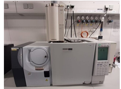
Abb. 1: Py-GC/MS

Durch die große Informationsfülle aus einem Messzyklus, die schnelle und genaue Arbeitsweise sowie die Anwendbarkeit auf eine Vielzahl von Materialien bietet die Pyrolyse (Py)-GC/MS großes Potenzial zur Erfüllung der hohen Anforderungen für das Monitoring von komplexen Materialien. Aus diesem Grund stand sie im Mittelpunkt des Forschungsprojektes.