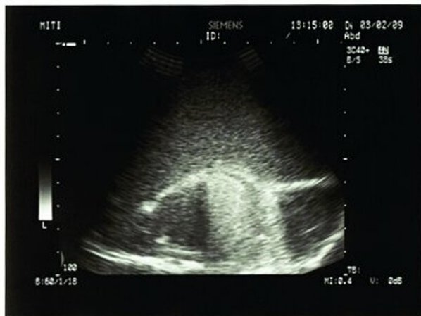
Abb. 1: Lebermodell mit Artefakten im Ultraschall

Categories: Biogenic Raw Materials Collagen