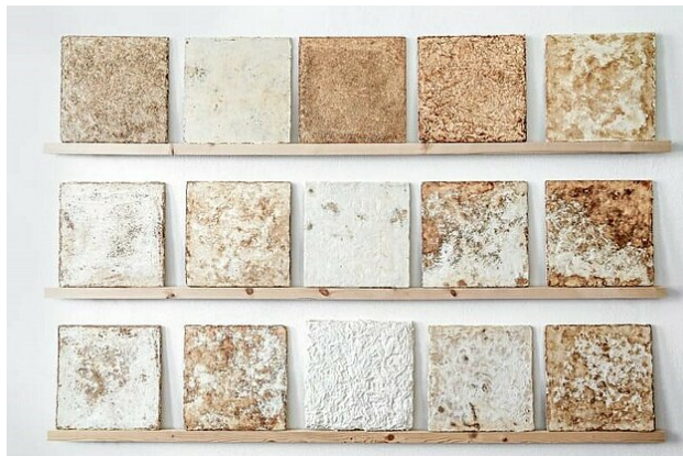
Abb. 1: Fliesen aus Pilzen

Kategorien: Biogene Rohstoffe Technische Textilien/Composite