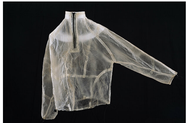
Abb. 2: Aus Goldschlägerhaut hergestellte Jacke