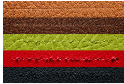
Abb. 2: Mit derselben Kratzspitze erzeugte Erscheinungsformen von Kratzern auf Bezugsmaterialien