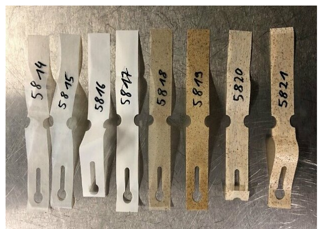
Abb. 2: Aus Stärke/Polyesterblends hergestellte Schlaufenetiketten für die Markierung von Häuten