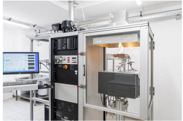
Abb. 2: Cone-Kalorimeter im Brennlabor